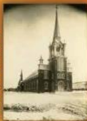
Crédit photo : 1920ca, Église de Saint-Ulric - Collection Félix Barrière, BMO, P748, 5/1/1955

Jusqu'à tard dans le XX e siècle, le perron de l'église est le lieu où se rassemblent les paroissiens pour avoir des nouvelles et socialiser. Il est aussi une place de choix pour les recruteurs de l'armée canadienne qui en recrutent les soldats.